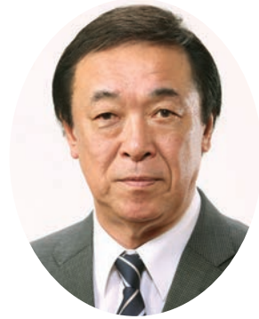
雄勝広域森林組合代表理事組合長