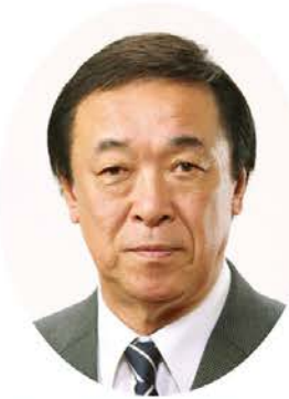
雄勝広域森林組合代表理事組合長